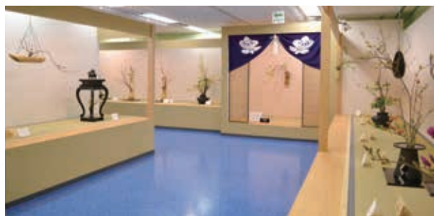
*照片中的作品是過去花展的例子

建於插花發祥地六角堂北邊的池坊會館將舉辦「春季花展」。以家元、次期家元為首，日本國內外約 1000 名華道家齊聚一堂，邀您鑑賞渾身的力作。