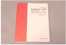
①指導者用マニュアル