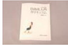
②生徒用お稽古ノート