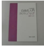
[指導者マニュアル2 (右)]