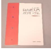
[指導者用マニュアル (左)]