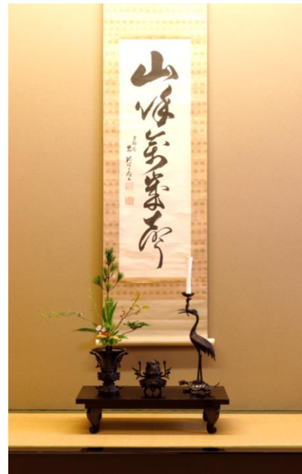
六角堂に伝わる聖徳太子の資料を公開！ 特集展示「聖徳太子といけばな」